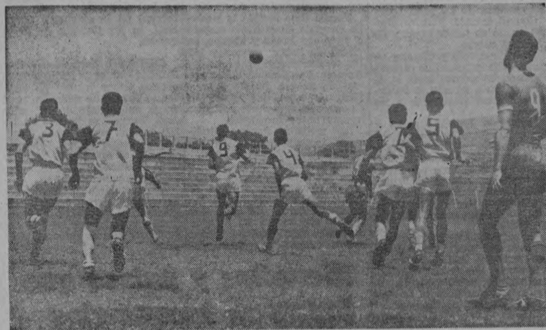
Se trata de un partido de Rugby, si no de un momento del encuentro de fútbol entre el Orión y el Uruguay, en el que vemos a siete jugadores de este último equipo defendiendo el resultado de empate a uno, que campeaba en aquellos momentos en el marcador.